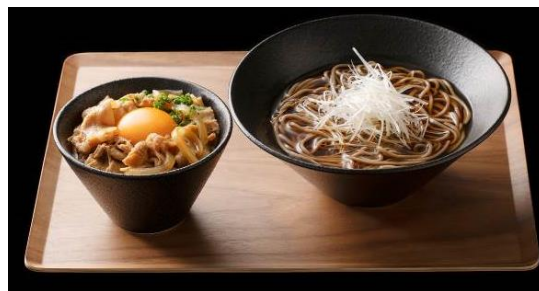
品名 蕎麦&29丼(にくどん) 価格 1,000円 麺大盛(+100g)1,100円