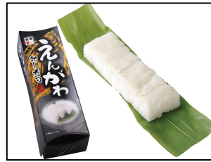
商品名: えんがわ押し寿司 販売価格: 1,480円