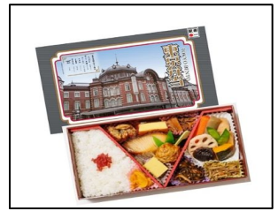
商品名: 東京弁当 販売価格: 2,000円