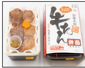
商品名: 炭火烧風牛タン弁当 販売価格: 1,380円