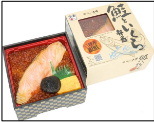
商品名: 鮭といくら弁当 販売価格: 1,580円