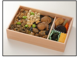
商品名: 品川貝づくし 販売価格: 1,150円