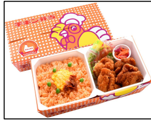
商品名: チキン弁当 販売価格: 900円