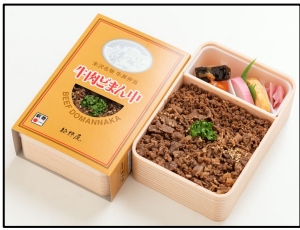
商品名: 牛肉どまん中 販売価格: 1,480円