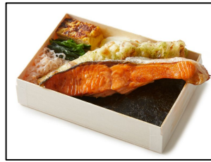
商品名: 海苔弁 海 販売価格: 1,296円